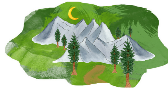
HIKING CHALLENGE RETO DE CAMINAR EN LA NATURALEZA

Complete 3 activities under a category to earn the challenge sticker on your reading map and an extra drawing ticket! ¡Completa 3 actividades en una categoría para ganar la calcomanía de reto en tu mapa de lectura y un boleto adicional!