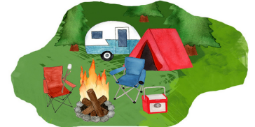
AROUND THE CAMPFIRE CHALLENGE RETO DE HOGUERA DE CAMPAMENTO