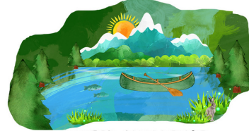
WATER CHALLENGE RETO DEL AGUA