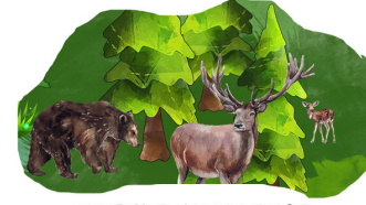
NATURE CHALLENGE RETO DE NATURALEZA